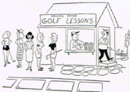
"Well, back to the salt mines!"

Han misset og måtte slite med en vrien putt på 4 fot for å halvere. Johan var på